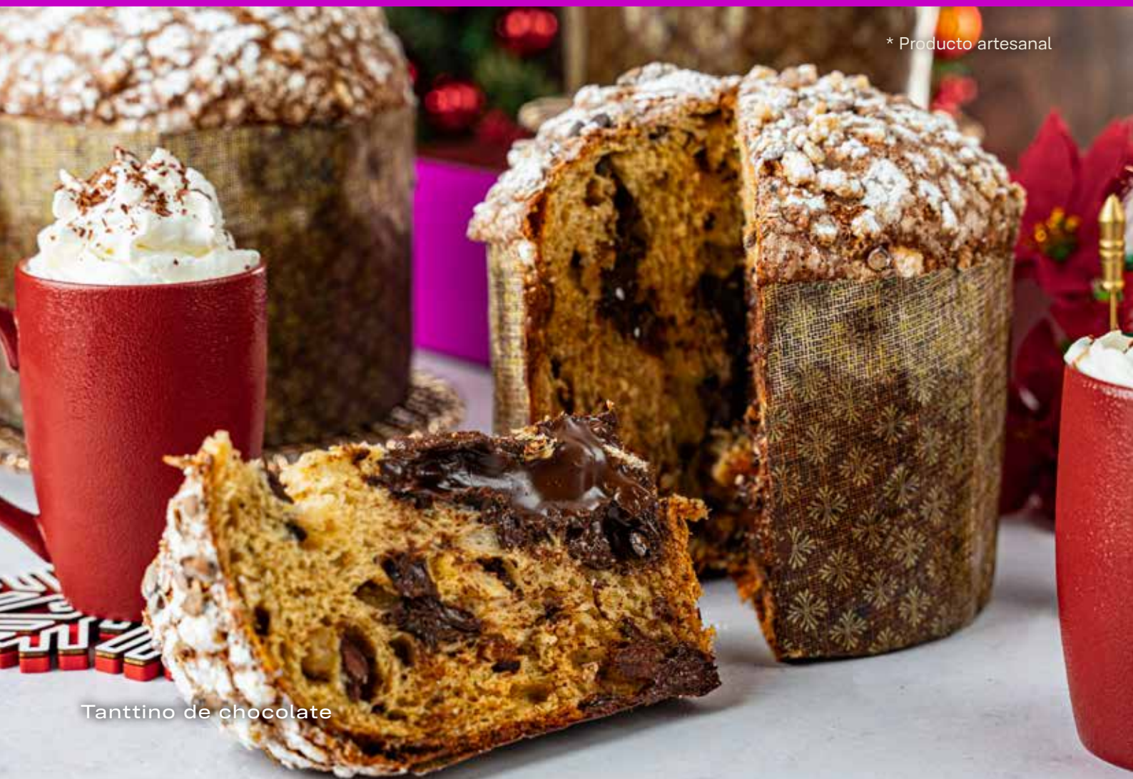
Tanttino de chocolate