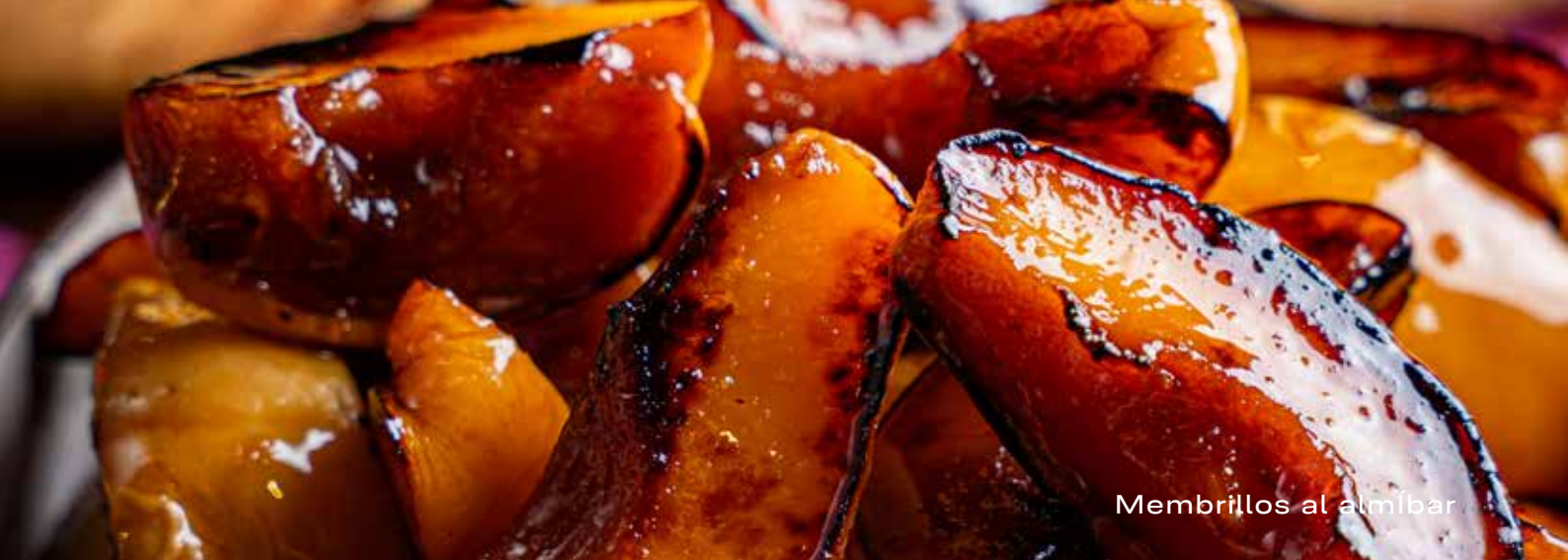
Membrillos al almíbar