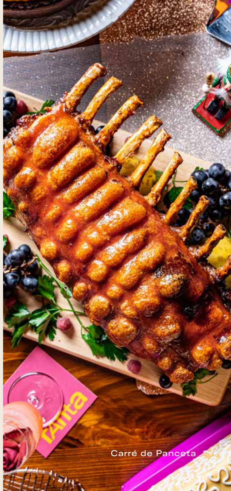
Carré de Panceta

Lechoncito de granja crocantito, con tacu tacu de frejoles negros y jugo de asado y naranja.