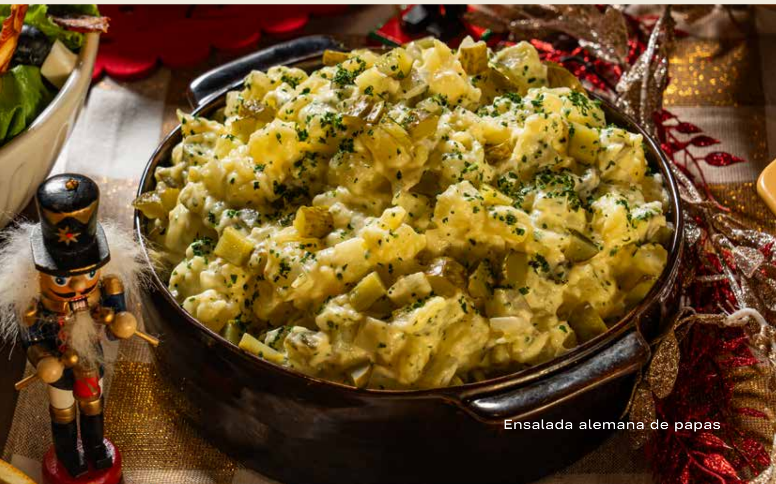
Ensalada alemana de papas