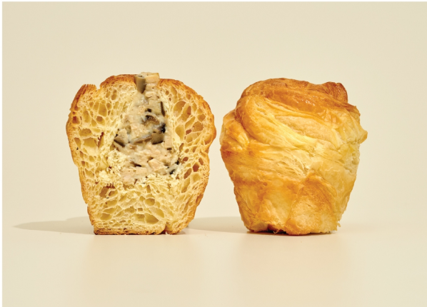
TRUFFLE MUSHROOM CRUFFIN ครัฟฟินชีสทรัฟเฟิลเห็ดทรัฟเฟิล (100 กรัม)