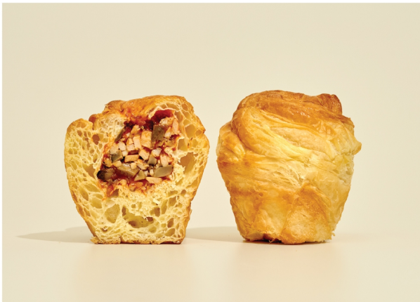
HAM & MUSHROOM CRUFFIN ครัฟฟินแฮมเห็ดทรัฟเฟิลชีสซอสมิซซ่า (100 กรัม)