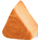
BUTTER ONIGIRI TIMBERRING กิมเบอริงโอนิกริเนยสด (45 กรัม) ราคาขายส่ง 40.-/50.- ราคาขายปลีก 75.-