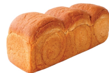
WHOLE WHEAT SHOKUPAN LOAF โชกูปังโคฟ โฮลวีท (965 กรัม) ราคาขายส่ง 175.-/220.- ราคาขายปลีก 250.-