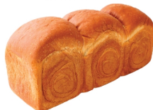
ORIGINAL SHOKUPAN LOAF โชกูปังโคฟ ออริจินอล (960 กรัม) ราคาขายส่ง 165.-/200.- ราคาขายปลีก 250.-